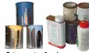
Paints, stains & solvents Pintura, barniz y disolvente