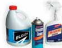
Household cleaners, aerosols & sprays Aerosoles, rociadores y productos de limpieza