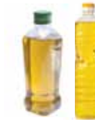
Fats, oils & grease (from food products, not hazardous waste) Grasas, mantecas y aceites (de cocina, no desechos peligrosos)