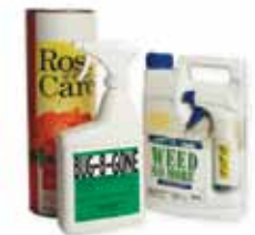
Pesticides, garden chemicals & pool chemicals Pesticidas, productos químicos para jardines y piscinas