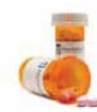
Pharmaceuticals* (no controlled substances) Productos farmacéuticos (pero no sustancias controladas)