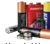
Household batteries* Baterías y pilas*