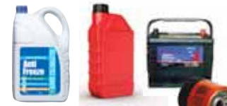
Automotive fluids & batteries Baterías y líquidos para automóviles

Cuando ya no quiera los productos tóxicos que se muestran abajo, llévelos a las instalaciones de recolección de desechos domésticos peligrosos de West Contra Costa (West Contra Costa Household Hazardous Waste (HHW)) para que los reciclen o los desechen en una forma segura.