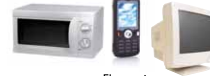
Electronics Aparatos electrónicos