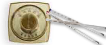
Mercury-containing items Artículos que contienen mercurio