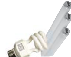
Fluorescent bulbs & tubes* Tubos y bombillos/focos fluorescentes*