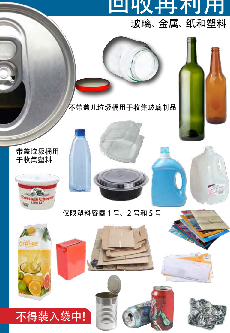
不带盖儿垃圾桶用于收集玻璃制品