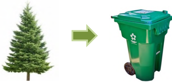
Los árboles naturales van en el bote verde